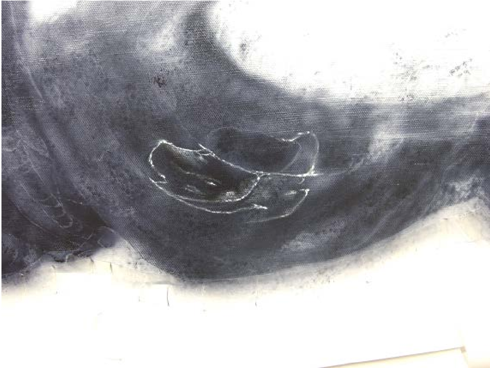
Das Ergebnis nach dem Bearbeiten mit IPA